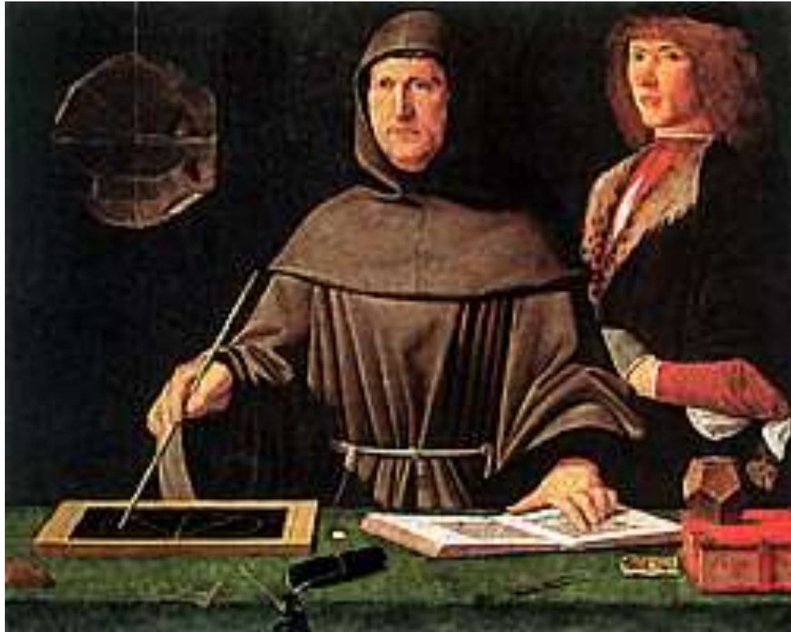
Портрет Лука Пачиоли - "Бащата" на счетоводството. Художник Леонардо да Винчи. Италия. Около 1510 година.